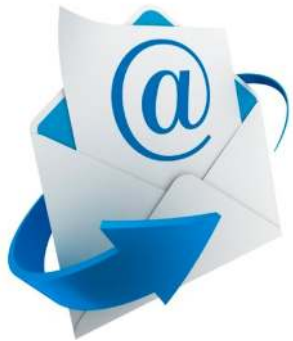
Mail de bienvenue